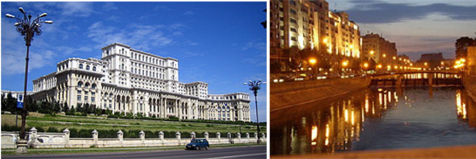
Giorno 3: Bucarest

Cena in un ristorante di fine cucina rumena e pernottamento a Bucarest, lo stesso albergo 4*.