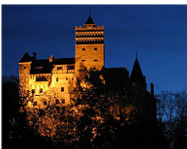
Giorno 2: Valle della Prahova

Partenza in mattinata direzione : la Valle della Prahova , famosa per i suoi castelli. Arrivo a Sinaia " la perla dei Carpazi " dove si potrà visitare il più bel castello rumeno, in stile bavarese, risalente ai tempi di re Carol I - il Castello di Peles . Nei pressi si trova Pelisor, la dimora dei regnanti - costruito per Ferdinando e Maria, eredi di re Carol I, e decorato dalla stessa regina Maria in stile art nouveau. Si prosegue verso Bran , con il Castello di Dracula , famoso in tutto il mondo per il principe sanguinario Vlad Tepes . Sempre nello stesso castello vi soggiornava ( nei periodi estivi ) la regina Maria per dei periodi di riposo lontani dalla corte .