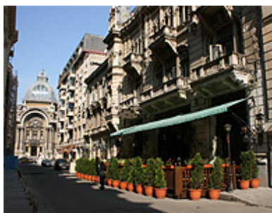
Giorno 1: Bucarest

Trasferimento dall'aeroporto e sistemazione in hotel centralissimo.