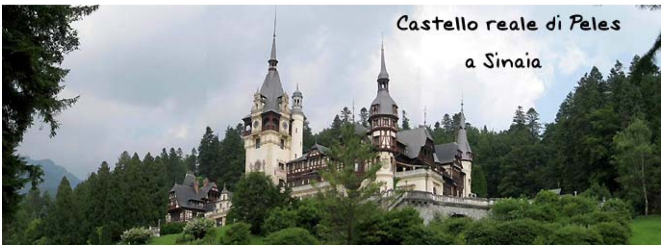
Castello reale di Peles a Sinaia